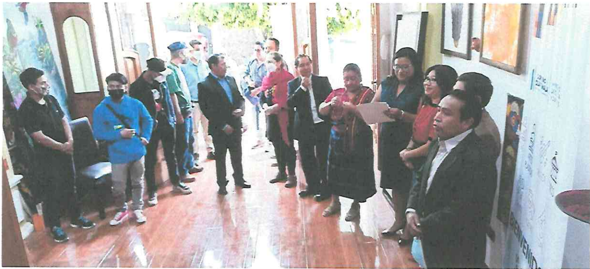
Explicación pública de la Obra, Sincretismo Cultural, Galería Ixiim, San Juan La Laguna, Sololá.