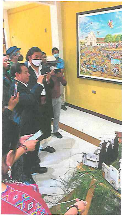
Explicación pública de la Obra, Sincretismo Cultural, Galería Ixiim, San Juan La Laguna, Sololá.