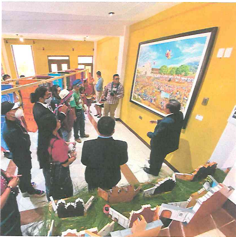
Explicación pública de la Obra, Sincretismo Cultural, Galería Ixiim, San Juan La Laguna, Sololá.